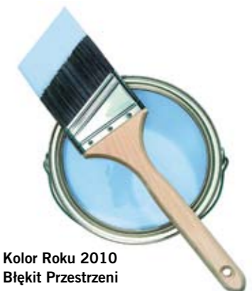
Kolor Roku 2010 Błękit Przestrzeni

2008 marka Dulux® wchodzi w skład portfolio koncernu AkzoNobel, największego producenta farb dekoracyjnych na świecie